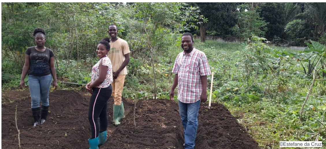
Figura 1 - Capacitação do CCAFS em novembro de 2021, São Tomé e Príncipe

O presente relatório sintetiza os resultados do estudo sobre o Estado da Arte da Agroecologia na Comunidade dos Países de Língua Portuguesa (CPLP), realizado no âmbito deste programa.